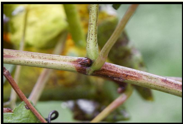
Príznak napadnutia na viniči (čierne pľuzgieriky)