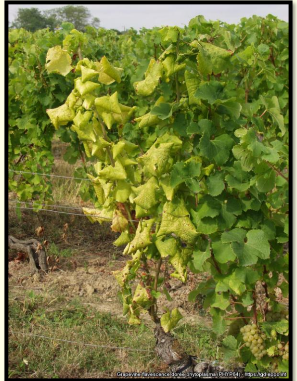
Žltnutie a stáčanie listov viniča