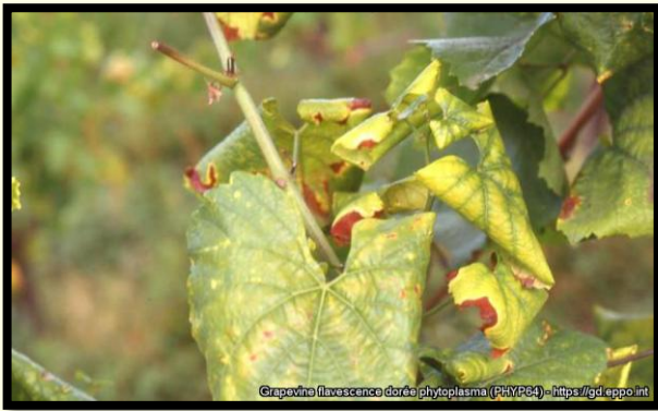
Detailnejší pohľad na žltnutie a stočenie listu viniča

Lokalizovať zlaté žltnutie viniča možno v cievných zväzkoch napadnutého viniča odkiaľ je prijímané vektormi pre ďalší prenos. Jediný infikovaný exemplár môže stačiť na prenos ochorenia a na začiatok nákazy. Fytoplazma bola nájdená v slinných žľazách infikovaného hmyzu (vektora) a sérologicky detegovaná v jednotlivých exemplároch.