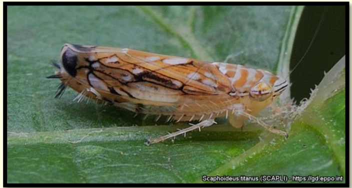
Scaphoideus titanus (cikádka viničová)