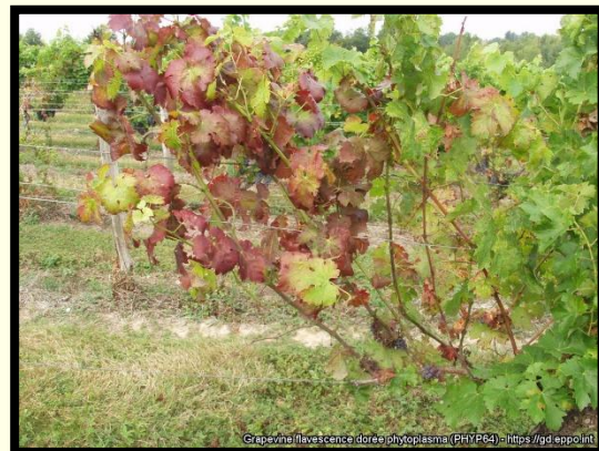
Príznak napadnutia na viniči (sčervenanie listov)