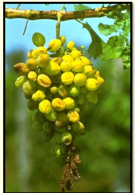
Príznaky pokročilej infekcie strapca hrozna so scvrknutými, miestami hnedými bobuľami